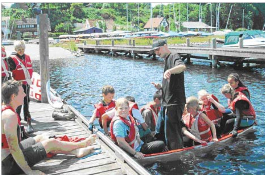
Træningen for børnene i Gadehaven bestod af forskellige lege og øvelser på vandet.