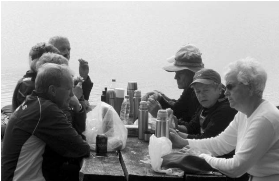
Undervejs blev der naturligvis også tid til en hyggelig frokost.

os skulle få lyst til en lille lur oven på den gode mad. Oven i de medbragte klemmer var der, så vidt jeg husker, hele tre forskellige kager til termokaffen. Flere på holdet havde åbenbart fået den tanke, at vi skulle have det godt, når vi nu var på sælsafari. Således mætte på måder satte vi kursen hen mod den del af kysten, hvor vi havde efterladt kajaktraileren. Kajakkerne blev læsset på igen og forsvarligt bundet fast, så vi var sikre på, at de blev liggende under transporten tilbage mod Roskilde. Men før vi forlod Avnø Naturcenter, skulle vi lige et smut op i udsigtstårnet og nyde synet af landskabet og fjorden. Dette dejlige syn blev en fin afrunding på en dejlig dag i gode kajakkammeraters lag.