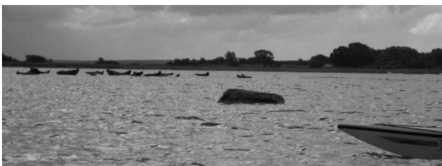
Sælerne nyder at ligge på stenene i Avnø Fjord, mens de nyder solen.

Vi satte kursen mod Avnø Naturcenter, der er indrettet på en tidligere flyveplads. Her blev vi modtaget af lederen af naturcentret, som formanede os om, at vi ikke måtte forstyrre sælerne. Efter, at hun havde modtaget vore forsikringer om, at vi kun agtede at kigge på - og ikke forstyrre sælerne, indvilgede hun i at åbne bommen til en markvej, så vi kunne køre traileren helt ned til vandkanten i Avnø Fjord.