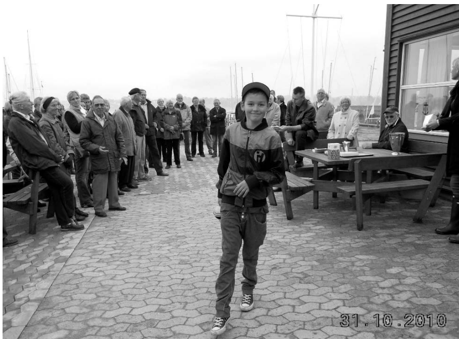
En synligt glad og meget stolt modtager af juniorpokalen.

Han er også en alsidig sejler, der på trods af sin alder kan sejle næsten hvad som helst. Han er også en god kammerat, der også gerne giver et nap med ved begynderundervisningen.