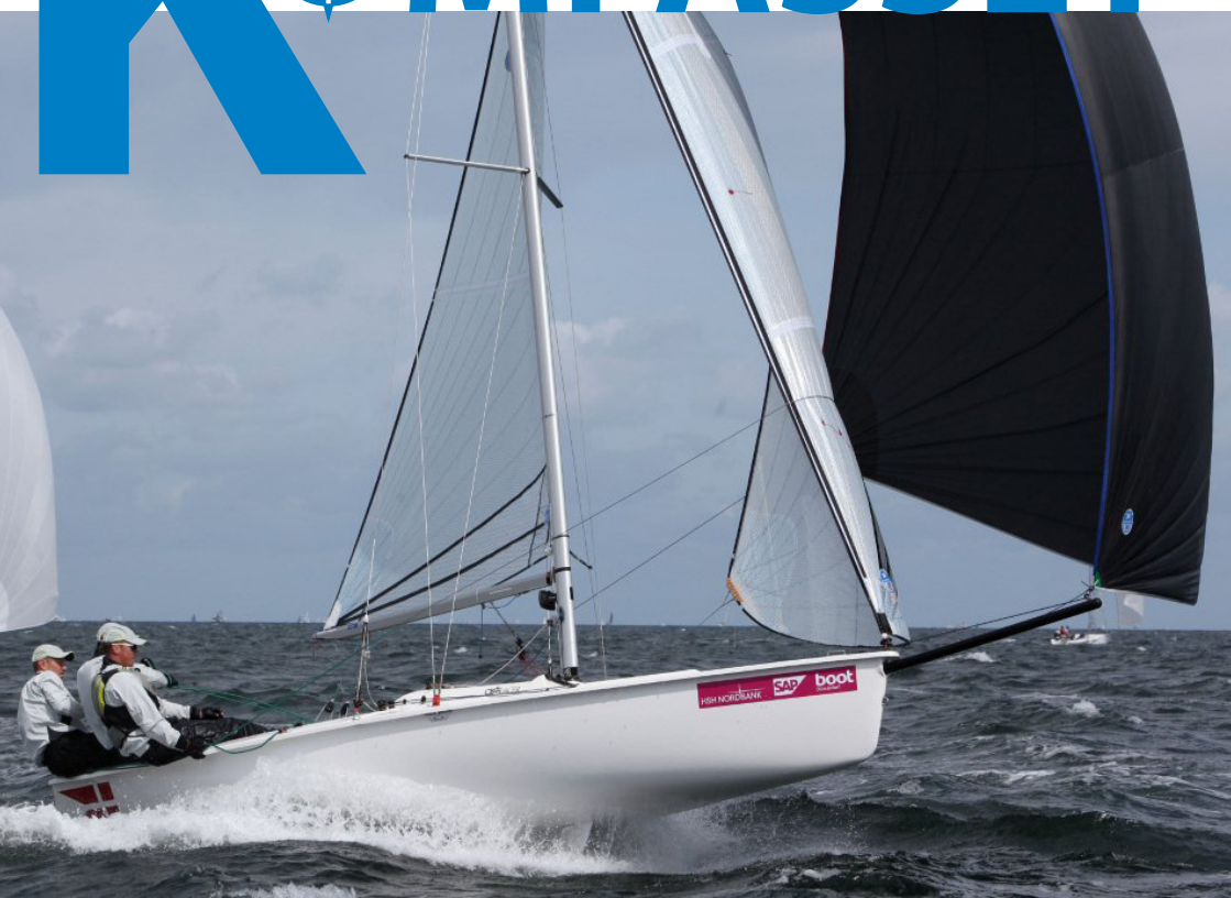
Roskildes nye CB66 besætning